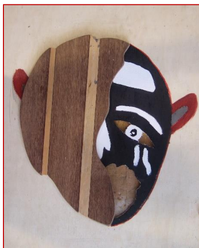
Création et photo de B. ALLAIN